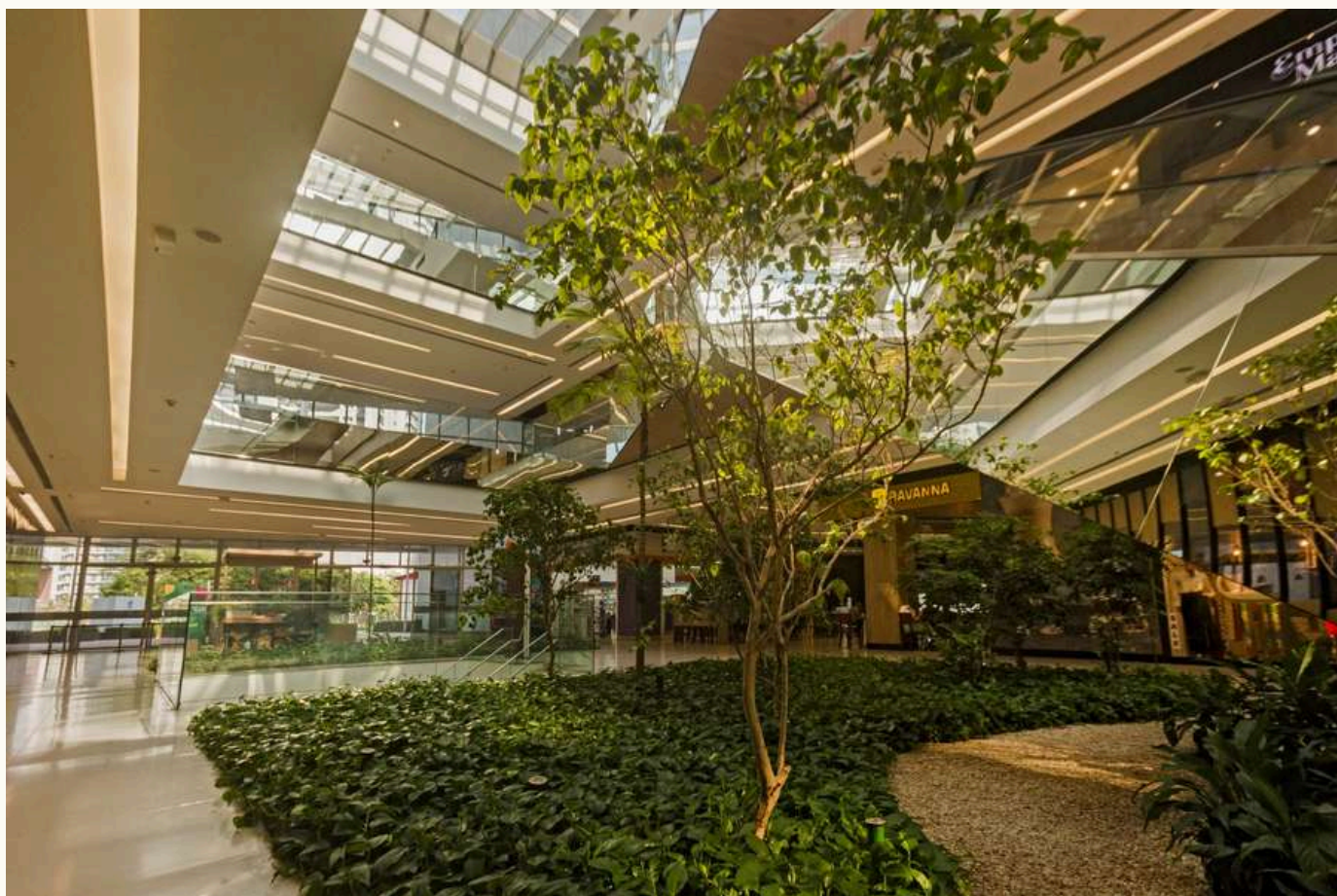
Shopping Parque da Cidade

Hotéis, shoppings e escritórios utilizam o paisagismo para melhorar a experiência dos visitantes e clientes, criando ambientes agradáveis e que valorizam o empreendimento. Paisagistas podem projetar desde entradas com jardins até áreas de descanso.